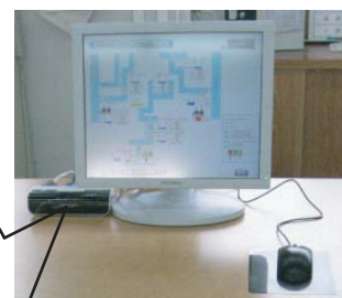
監視局 複数箇所増設可能