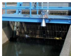
観測局 観測制御局 * 水位・水門状態監視 * 水門ゲート制御